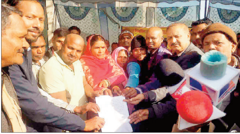
लिखित आश्वासन देते अधिकारी।

गुरु घासीदास नेशनल पार्क सहित घने जंगल पर पहाड़ों पर स्थित बस्तियों में विद्युत विस्तार की बात तो कोई सोच भी नहीं सकता था। विद्युत विभाग ने आधा दर्जन से अधिक सर्वे कराने के बाद इन गांवों में वन बाधा के कारण विद्युत विस्तार को असम्भव मान लिया था। क्षेत्र के राजस्व ग्रामों में भी विद्युत विस्तार को लेकर अनेक समस्याएं आ रही थी। विद्युत अधिकारी विस्तार के लिए वन विभाग की अनापत्ति मिलने के बाद प्रक्रिया आगे बढ़ाने का आश्वासन दे रहे थे। अनेकों प्रयास के बाद भी जब सफलता नहीं मिली तो करौटी ए सरपंच ने